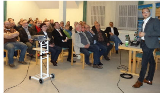
Info-Abend zum Thema Bauen und Sanieren Schönau mit einer Vielzahl an interessierten Bürgern.